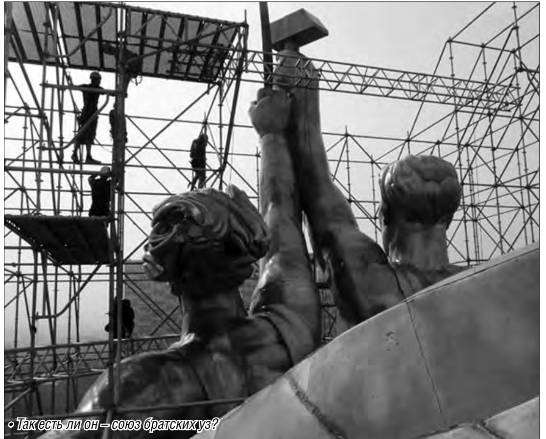
«Так есть ли он – союз братских уз?»

что СССР юридически жив, разделяет немало юристов. Для того, чтобы Союза не стало с правовой точки зрения, надо было выполнить процедуры, прописанные законом «О порядке решения вопросов, связанных с выходом союзной республики из СССР» от 1990 года. Там сказано, что решение о выходе союзной республики из СССР считается принятым «посредством референдума, если за него проголосовало не менее двух третей граждан СССР, постоянно проживающих на территории республики к моменту постановки вопроса о ее выходе из СССР». Действительно, ни в