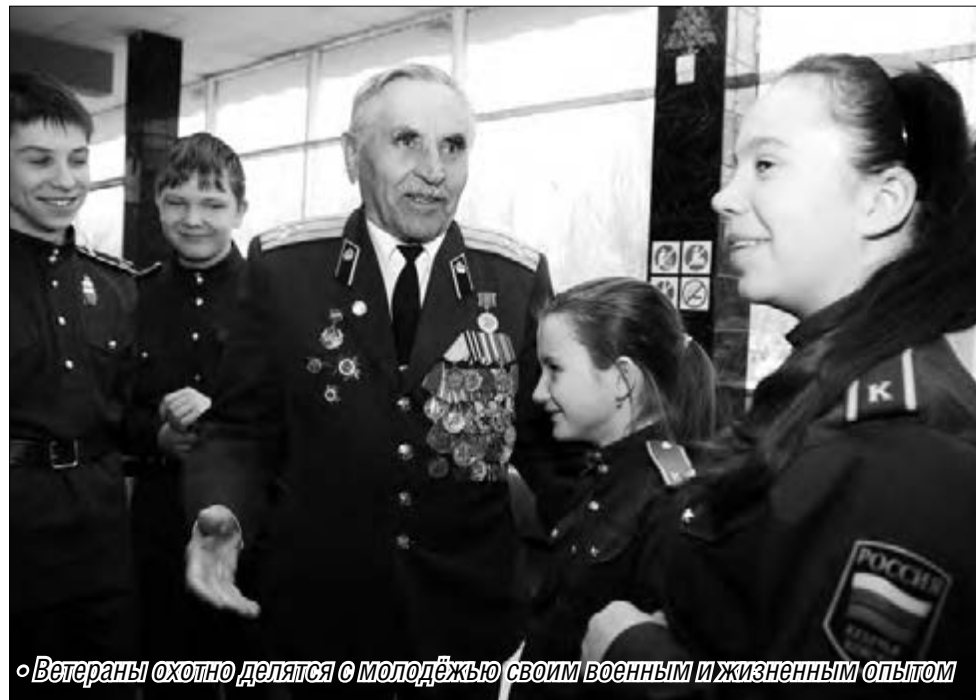
«Ветераны охотно делятся с молодёжью своим военным и жизненным опытом»

А гвардии сержант, ветеран воздушно-десантных войск, участник взятия Венгрии и Австрии, освобождения Чехословакии