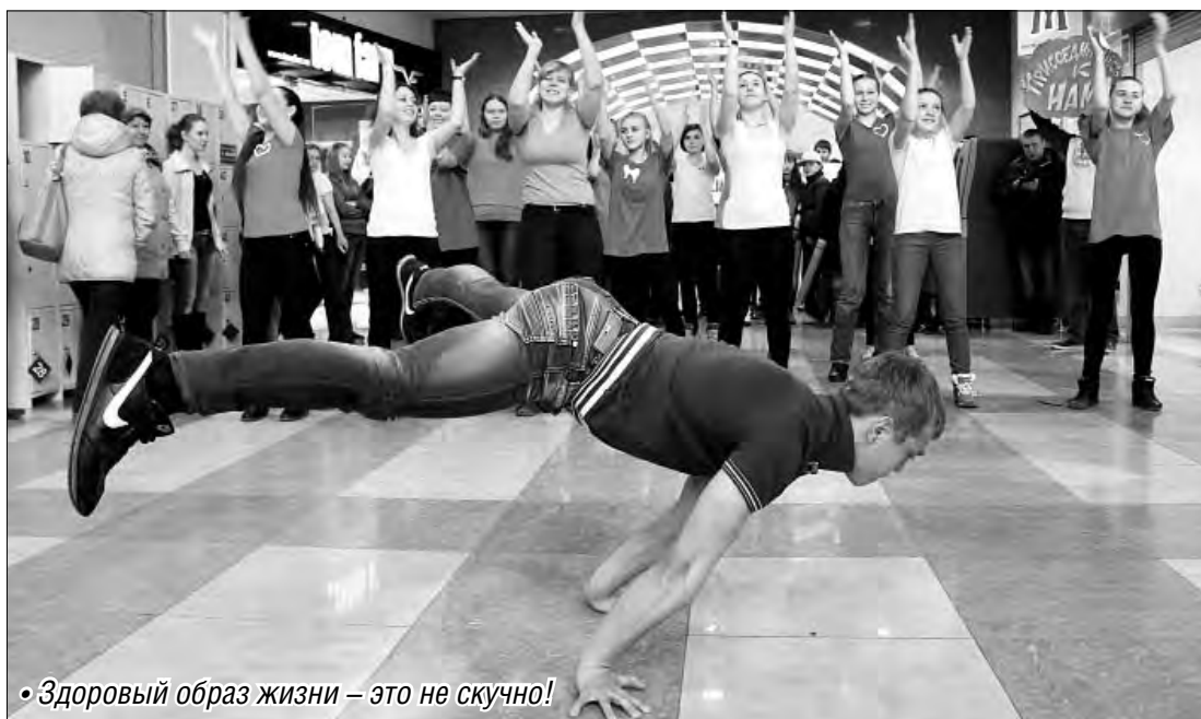
«Здоровый образ жизни – это не скучно!»

Городской парламент школьников работает при Дворце творчества детей и молодежи, активисты из всех школ Магнитогорска под руководством педагогов Дворца регулярно в