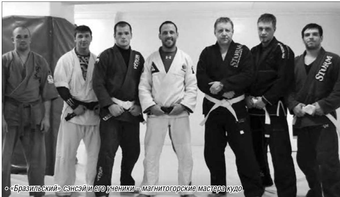
«Бразильский» сэнсэй и его ученики – магнитогорские мастера кудо