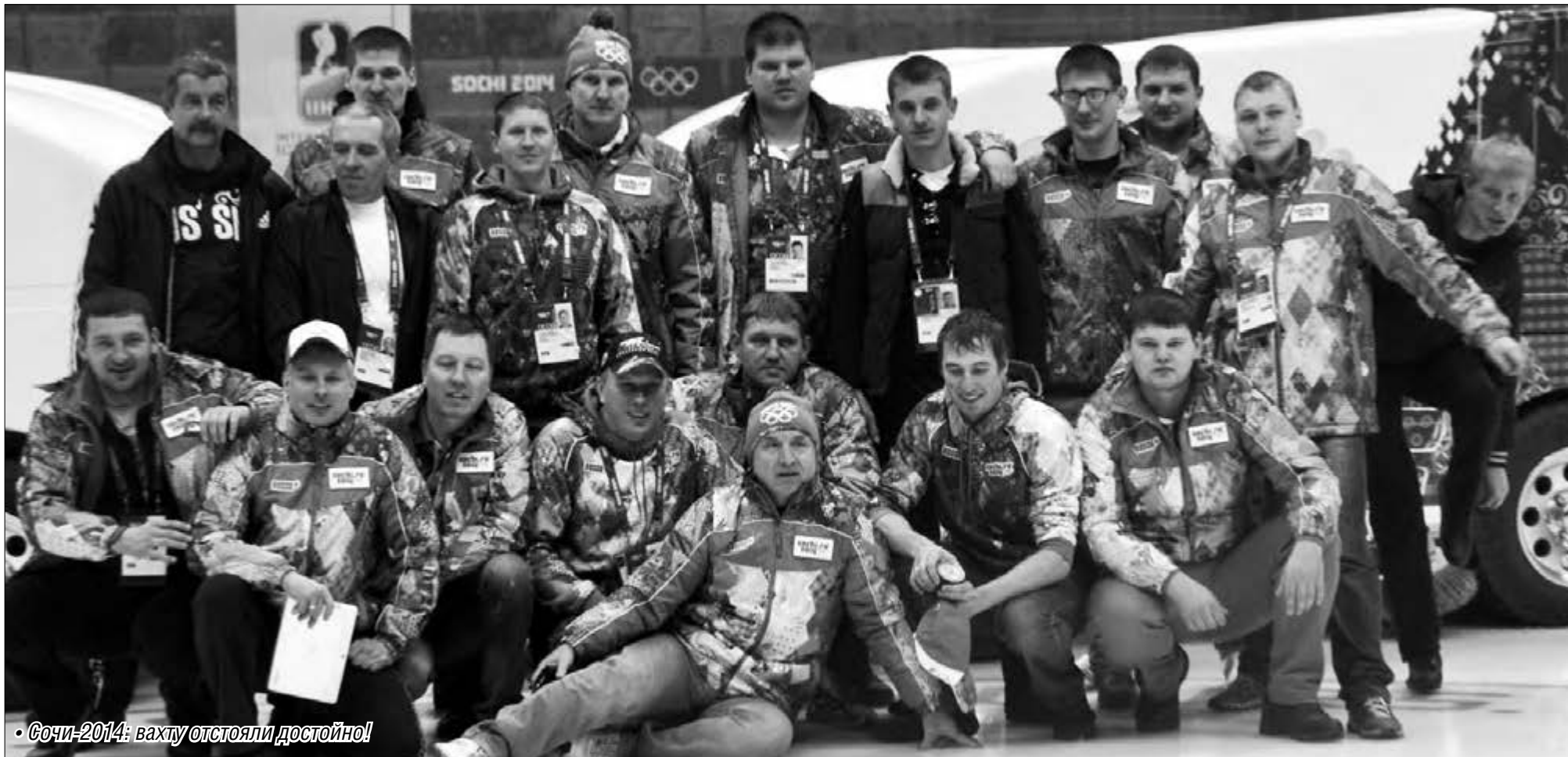
• Сочи-2014: вахту отстояли достойно!

Опыт магнитогорцев по оборудованию и эксплуатации ледовых арен пригодился на зимних Олимпийских Играх в Сочи